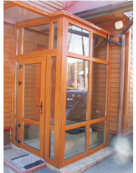
Zabudowa PVC z drzwiami