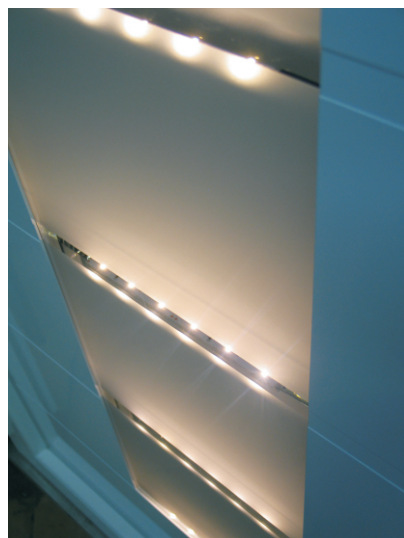
PODŚWIETLENIE LED DRZWI ZEWNĘTRZNE

ogrody zimowe: wykonywane z PVC w systemie Kommerling EuroFutur Classic z drzwiami przesuwным, harmonijkowymi, rozwiernymi, dachem szklanym, z poliwęglanu