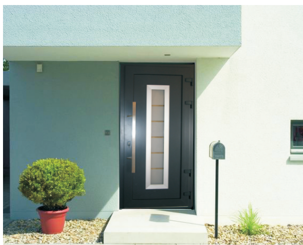
Drzwi zewnętrzne EXD Antracyt