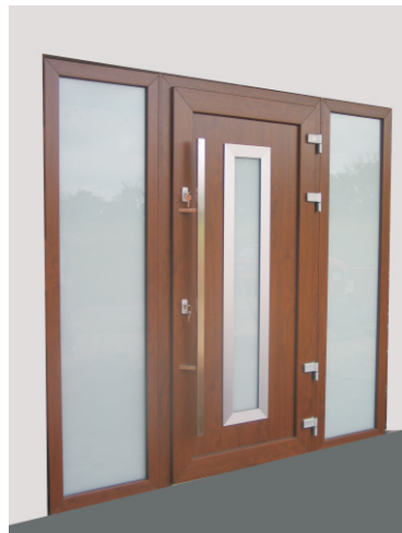
Drzwi zewnętrzne EXD złoty dąb