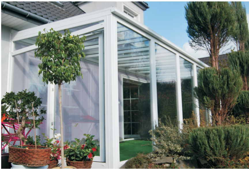
Ogród zimowy PVC w systemie EuroFtur Classic